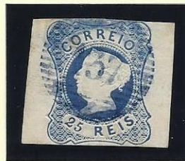
137 ABRANTES (A AZUL)