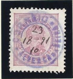
ALVERCA DA BEIRA (A VIOLETA)