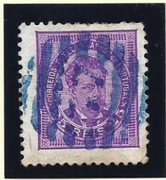
77 VILA VERDE (A AZUL)