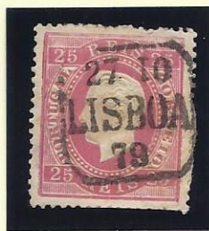
LISBOA (A VERDE)