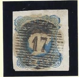
17 CALDAS DA RAINHA