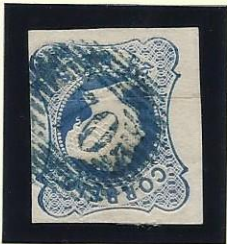
70 PENAFIEL (A AZUL)