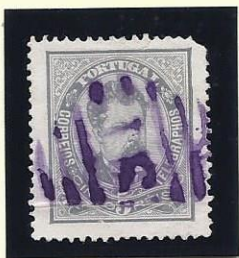
91 ESTAREJA (A VIOLETA)