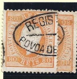
POVOA DE VARZIM