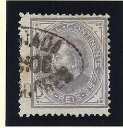
FORNOS DE ALGODRES