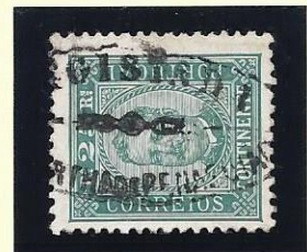
S. MARTHA DE PENAGUIÃO