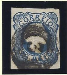
3 ALCOBAÇA (CÍRCULOS)