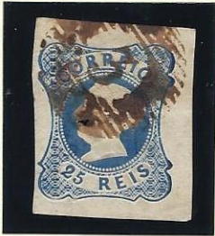
3 ALCOBAÇA (A SÉPIA)