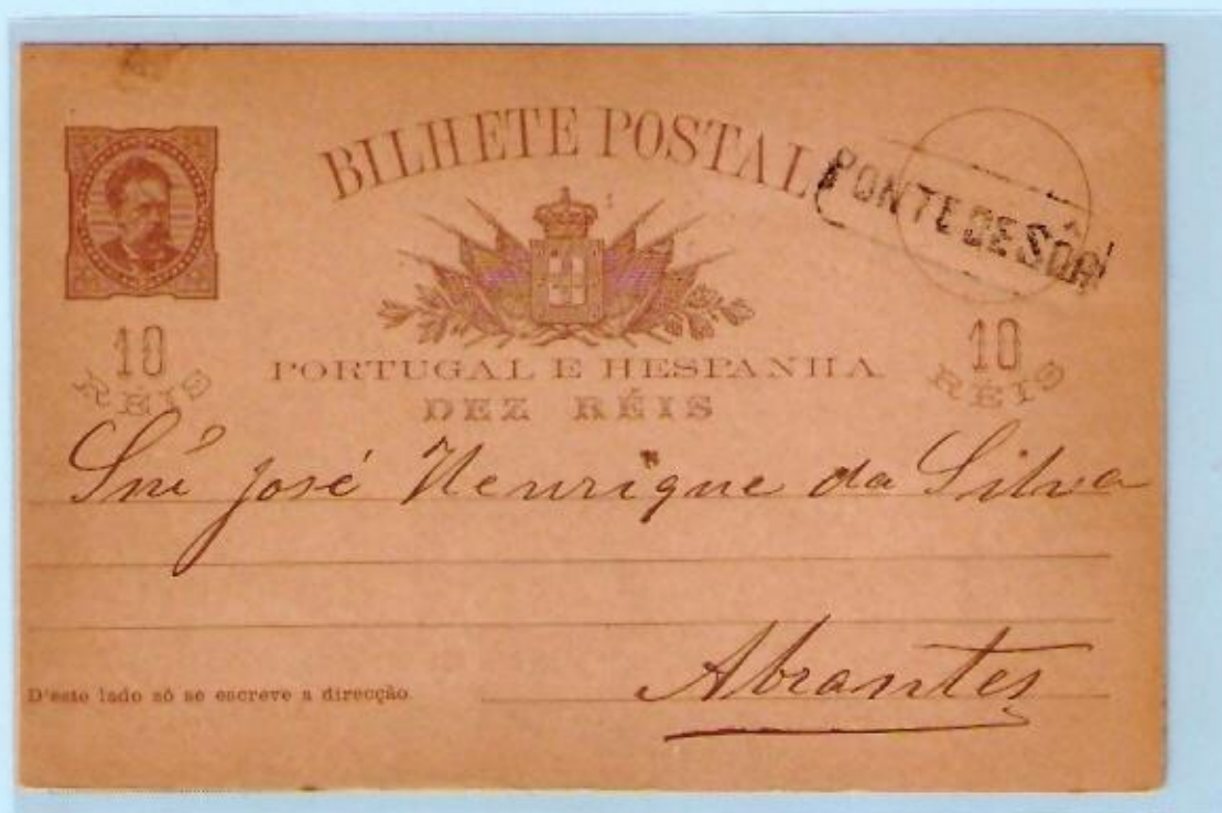
PONTE DE SÔR [5/2/89], ABRANTES

PONTE DE SÔR 1884-87 - D. LUIS, DE FRENTE, 10 REIS, OM 9