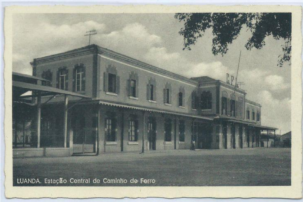
LUANDA. Estação Central de Caminho de Ferro

LUANDA. Estação Central de Caminho de Ferro.