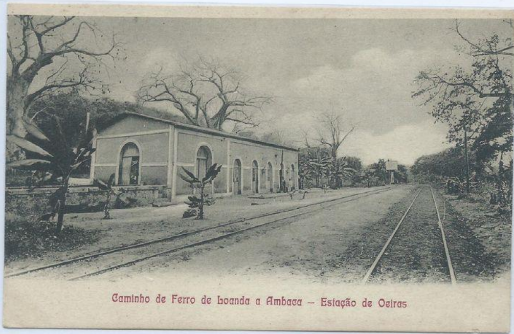
Caminho de Ferro de Luanda a Ambaca -- Estação de Oeiras