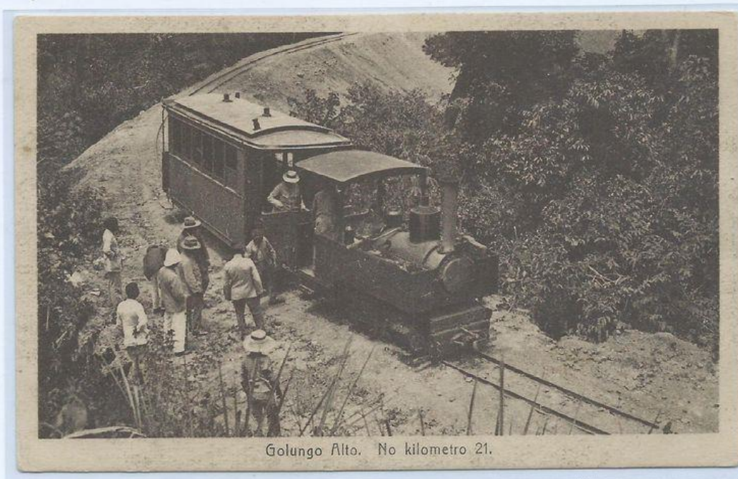
Ramal do Golungo Alto. Editores: Carvalho & Freitas, Lda. Luanda.