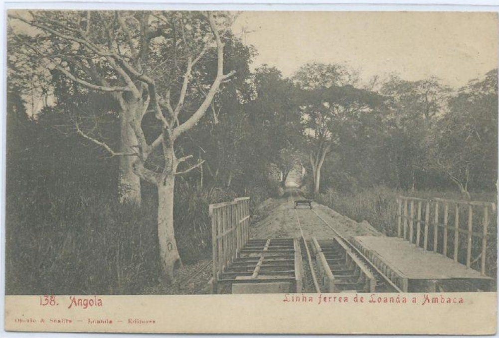
Linha férrea de Loanda a Ambaca. Editor: Osório A. Seabra. Luanda.