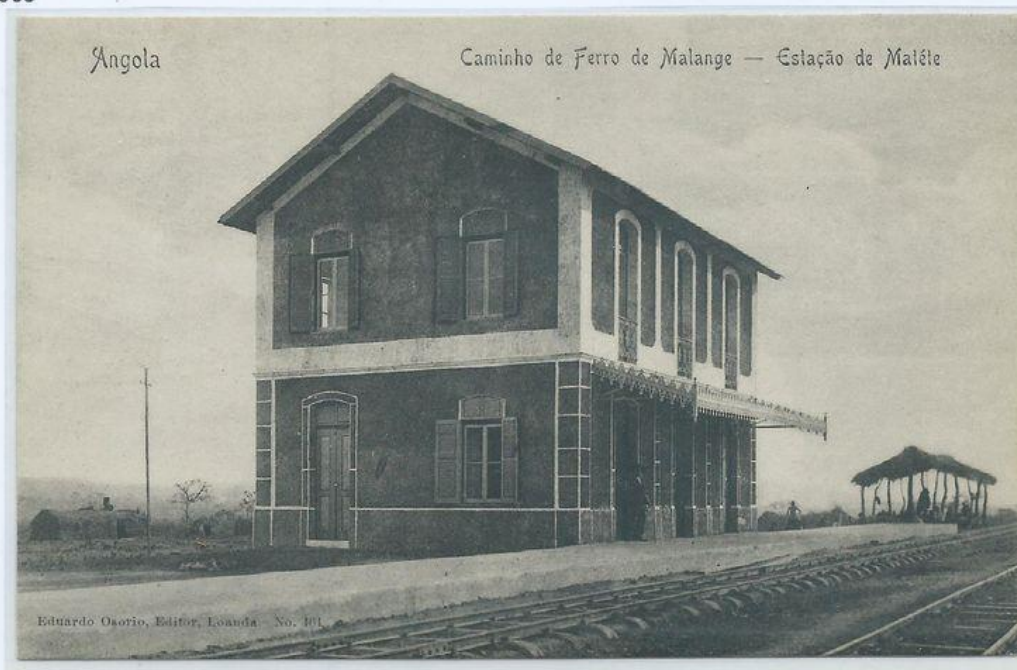
Estação de Matete. Editor: Eduardo Osório. Luanda.