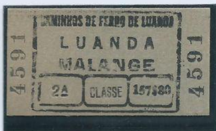
Bilhete de 2ª classe. Luanda-Malange