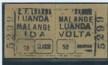
Bilhete de ida e volta. Luanda-Malange; Malange-Luanda